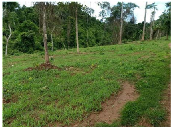
จัดทำทุ่งหญ้าสำหรับเป็น แหล่งอาหารสัตว์ป่า จำนวน ๑๕๐ ไร่