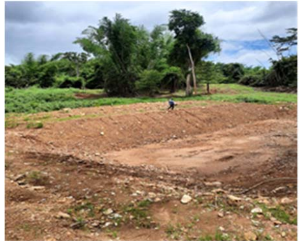
ปรับปรุงแหล่งน้ำสำหรับสัตว์ป่า ขนาด ๑,๐๐๐ ลูกบาศก์เมตร จำนวน ๔ แห่ง