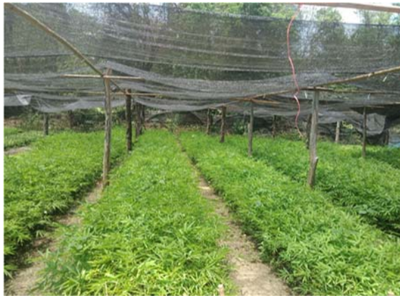
จัดหาและรวบรวมพืชอาหารช้าง (พันธุ์ไม้ท้องถิ่น) จำนวน ๓๐,๐๐๐ กิโลกรัม

ตั้งอยู่บริเวณพื้นที่บ้านร่วมใจพัฒนา หมู่ที่ ๒ บ้านป่าแดง หมู่ที่ ๓ บ้านสวนใหญ่พัฒนา หมู่ที่ ๕ บ้านป่าแดงใต้ หมู่ที่ ๖ บ้านห้วยสัตว์ใหญ่ หมู่ที่ ๗ บ้านเขาแหลม หมู่ที่ ๘ และบ้านปางไม้ หมู่ที่ ๙ ตำบลป่าแดง อำเภอแก่งกระจาน จังหวัดเพชรบุรี และบริเวณพื้นที่ป่าสงวนแห่งชาติป่ายางน้ำกลัดเหนือ - ยางน้ำกลัดใต้ ดำเนินการจัดทำแหล่งน้ำ แหล่งอาหารให้ช้างป่าและสัตว์ป่า จัดหาและรวบรวมพืชอาหารช้าง (พันธุ์ไม้ท้องถิ่น) จำนวน ๓๐,๐๐๐ กิโลกรัม ปรับปรุงแหล่งน้ำสำหรับสัตว์ป่า ขนาด ๑,๐๐๐ ลูกบาศก์เมตร จำนวน ๒ แห่ง ปรับปรุงทุ่งหญ้าสำหรับเป็นแหล่งอาหารสัตว์ป่า จำนวน ๒๐๐ ไร่ และจัดทำโป่งเทียม จำนวน ๒๐ แห่ง