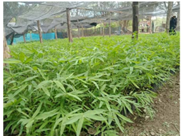
จัดหาและรวบรวมพืชอาหารช้าง (พันธุ์ไม้ท้องถิ่น) จำนวน ๓๐,๐๐๐ กิโลกรัม