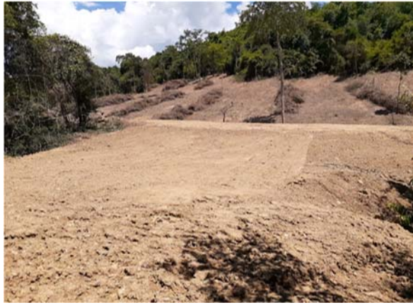
ปรับปรุงทุ่งหญ้าสำหรับเป็น แหล่งอาหารสัตว์ป่า จำนวน ๒๐๐ ไร่