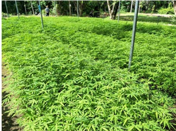
จัดหาและรวบรวมพืชอาหารช้าง (พันธุ์ไม้ท้องถิ่น) จำนวน ๒๐,๐๐๐ กล้า

ตั้งอยู่บริเวณพื้นที่อุทยานแห่งชาติแก่งกระจาน จังหวัดเพชรบุรีและจังหวัดประจวบคีรีขันธ์ ดำเนินการจัดหาและรวบรวมพืชอาหารช้าง (พันธุ์ไม้ท้องถิ่น) จำนวน ๒๐,๐๐๐ กล้า ปรับปรุงแหล่งน้ำธรรมชาติสำหรับช้างป่าและสัตว์ป่า ขนาด ๑,๐๐๐ ลูกบาศก์เมตร จำนวน ๓ แห่ง จัดทำทุ่งหญ้าแหล่งอาหารช้างป่าและสัตว์ป่า จำนวน ๑๕๐ ไร่ จัดทำโป่งเทียม จำนวน ๒๐ แห่ง และบำรุงรักษาแปลงหญ้าเดิมเพื่อเป็นแหล่งอาหารให้ช้างป่าและสัตว์ป่า จำนวน ๑๕๐ ไร่