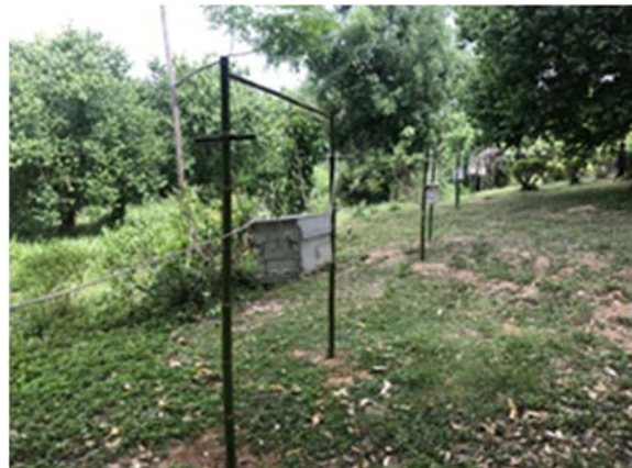
ชุดรั้วรั้งฝั่งสาธิตเพื่อการเรียนรู้พร้อมอุปกรณ์ติดตั้ง จำนวน ๓ ชุด