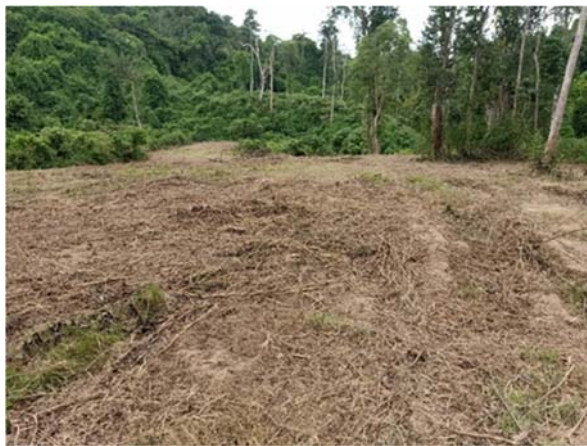
ปรับปรุงทุ่งหญ้าสำหรับเป็น แหล่งอาหารสัตว์ป่า จำนวน ๑๕๐ ไร่