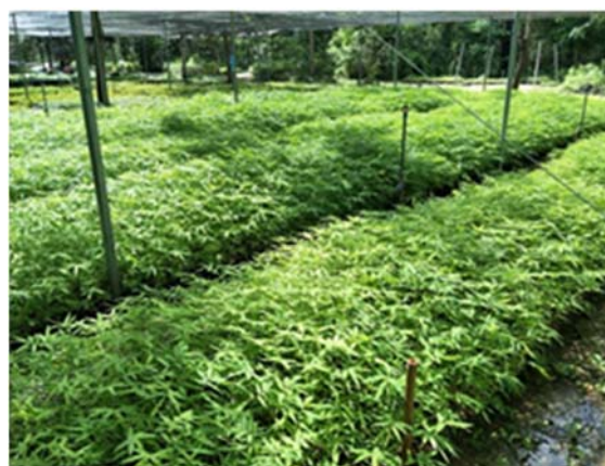
จัดหาและรวบรวมพืชอาหารช้าง (พันธุ์ไผ่ทองถิ่น) จำนวน ๓๐,๐๐๐ กกล้า