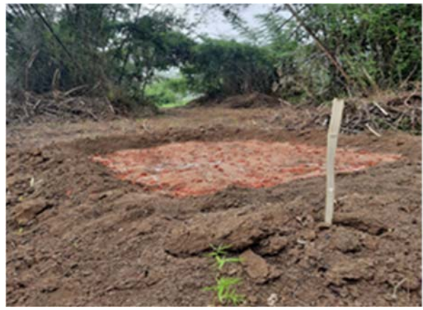
จัดทำโป่งเทียม จำนวน ๒๐ แห่ง