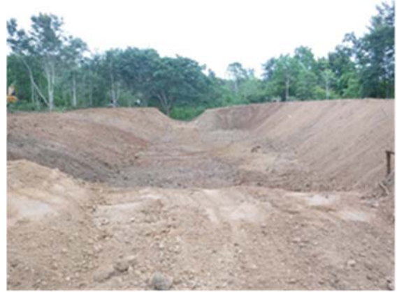
ปรับปรุงแหล่งน้ำสำหรับสัตว์ป่า ขนาด ๑,๐๐๐ ลูกบาศก์เมตร จำนวน ๓ แห่ง