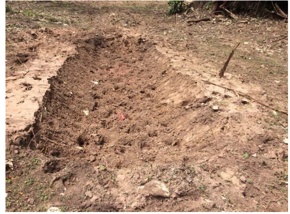
จัดทำโป่งเทียม จำนวน ๒๐ แห่ง