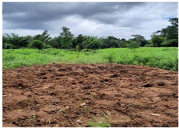
ร่องรอยเท้าช้างป่าและสัตว์ป่าที่มากินโป่งเทียม