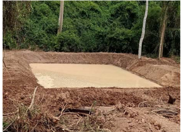
ปรับปรุงแหล่งน้ำสำหรับสัตว์ป่า ขนาด ๑,๐๐๐ ลูกบาศก์เมตร จำนวน ๓ แห่ง