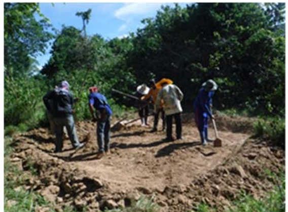
จัดทำโป่งเทียม จำนวน ๒๐ แห่ง