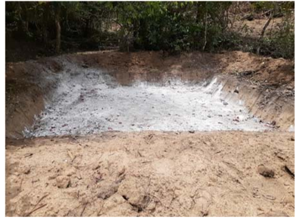
จัดทำโป่งเทียม จำนวน ๒๐ แห่ง