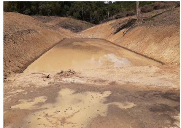
ปรับปรุงแหล่งน้ำสำหรับสัตว์ป่า ขนาด ๑,๐๐๐ ลูกบาศก์เมตร จำนวน ๒ แห่ง